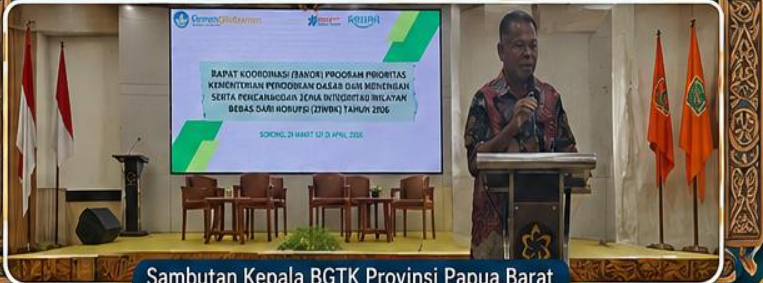
Sambutan Kepala BGTK Provinsi Papua Barat