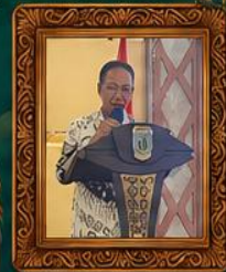
Sesi Presentasi Kerja