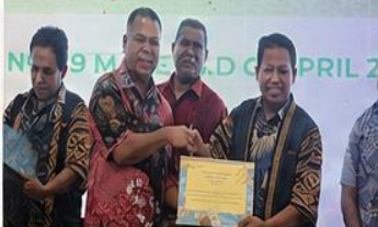
Serah Terima Sertifikat dan Komitmen Bersama