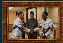
Penandatanganan Nota Kesepahaman