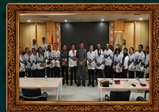
Peserta Konferensi Kerja XXIII