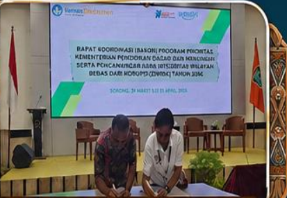
Proses Penandatanganan Pencanangan ZIWBK Tahun 2026