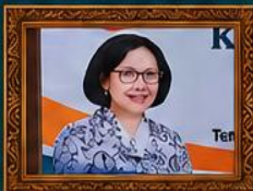
Sambutan Ketua Umum PB PGRI (Daring)