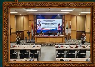
Ruang Pertemuan Utama Lt. 3 Kantor Gubernur