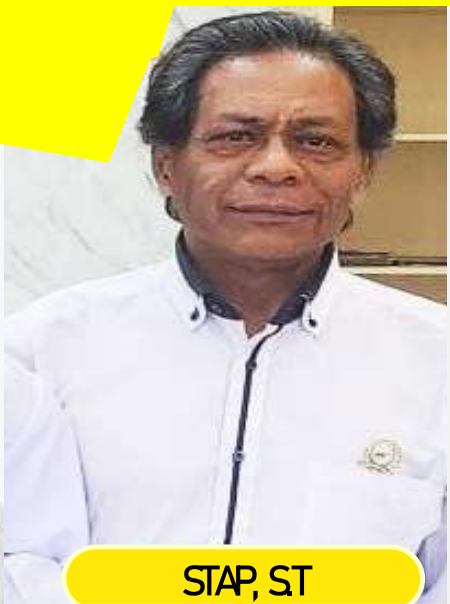
STAP, ST POKJA PAPUA PRODUKTIF, BP30KP