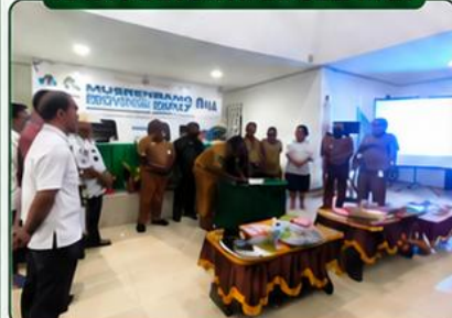
KAB. MANOKWARI SELATAN